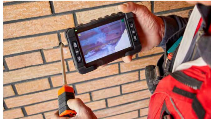
Zu Beginn wird die Wand bzw. die Hohlschicht an mehreren Stellen mittels eines Endoskops auf ihre Beschaffenheit hin untersucht.