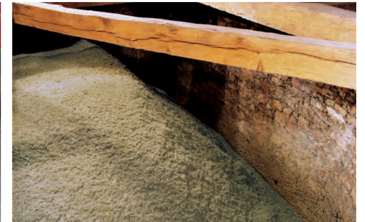
Abrutschsicher mit Fillrock RG aufgebaute Dämmschicht. Die Dämmschicht ist auch bei gewölbten Untergründen lagestabil.