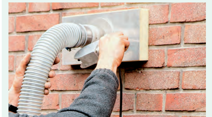
Die Großdüse wird aufgesetzt und der Hohlraum ausgeblasen.

Informationen zur nachträglichen Kerndämmung sowie ein Verarbeitungsvideo finden Sie auch online: