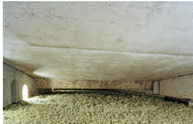
Mit Fillrock RG gedämmtes belüftetes Flachdach

Die Dämmarbeiten sind in den meisten Fällen nicht besonders aufwendig und der Vorgang der Dämmung dauert nur wenige Stunden. Falls eine Einblasöffnung geschaffen werden muss, wird diese nach Beendigung des Vorgangs wieder fachgerecht verschlossen. Die Sanierung bedeutet also in den meisten Fällen, dass nur wenig Lärm entsteht und der zeitliche Umfang der Dämmmaßnahme sehr überschaubar bleibt.