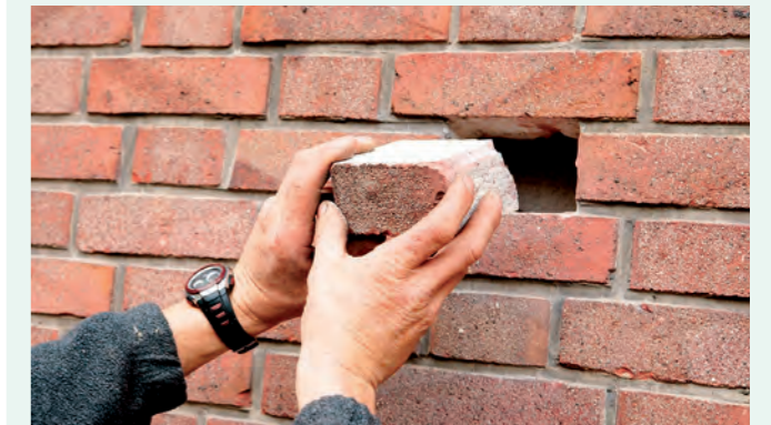
Aus dem Vormauerwerk wird ein ganzer oder ein halber Ziegel entnommen.