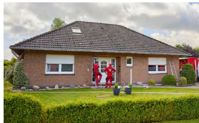
..., sodass man später nicht mehr erkennen kann, an welchen Stellen sich die Bohrlöcher befanden. Schnell, sauber und unkompliziert.