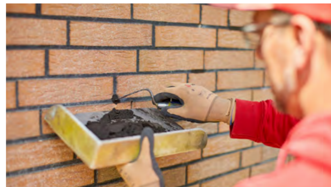
Selbstverständlich werden die Bohrlöcher nach dem Einblasvorgang wieder sauber verfügt ...