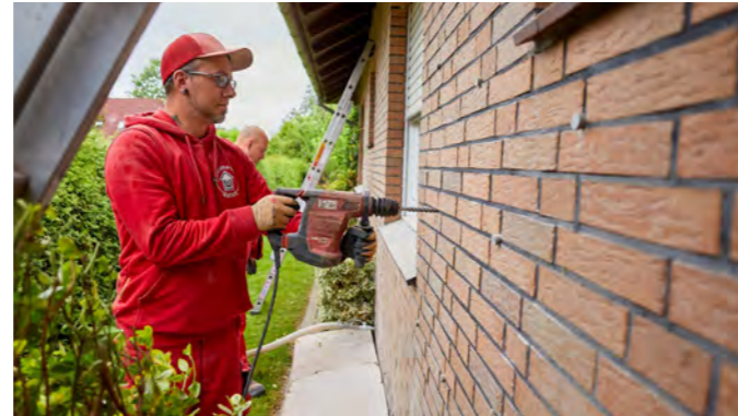
Im Anschluss erfolgen Bohrungen in die T-Fugen der Fassade in gleichmäßigen Abständen.