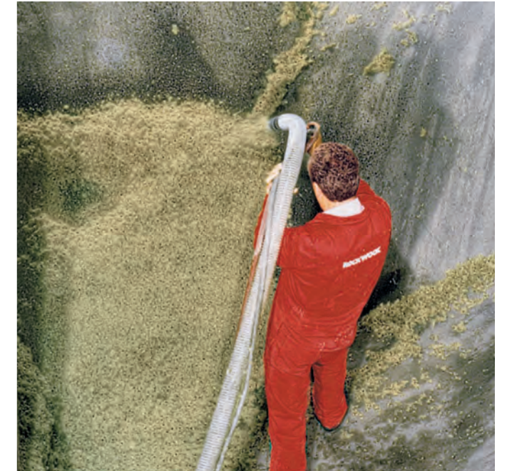
Gleichmäßiges Aufbringen der fugenlosen Dämmschicht. Anschlie-ßend werden die Steinwolle-Flocken mit Sprühkleber benetzt.

Schichtweise werden die Steinwolle-Flocken Fillrock RG/RG Plus mit der Sprühklebetechnik bis zur gewünschten Dicke aufgespritzt. Die Höhe der Dämmschicht kann bis zu 20 cm betragen. Anschließend wird die Dämmschicht mit einer dünnen Klebe-schicht benetzt, um eine Verfestigung der Oberfläche zu erreichen.