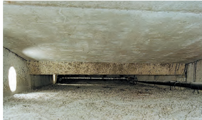
Belüftetes Flachdach vor dem Einbringen von Fillrock RG

Für das Einblasen können die Steinwolle-Flocken Fillrock RG und Fillrock RG Plus verwendet werden. Das Granulat wird, der Bau-situation entsprechend, im Zwischenraum von Dachabdichtung und Raumdecke eingeblasen bzw. aufgeblasen. Selbstverständlich wird vorher überprüft, ob eine ggf. bereits vorhandene Dämmung den Vorgaben des GEG entspricht oder ob die Konstruktion nur unzu-reichend gedämmt war. Auch mögliche bauphysikalische Auswirkun-gen auf die Konstruktion sollten eingeplant werden.