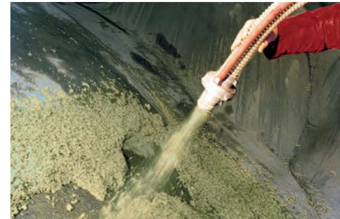
Steinwolle-Flocken und Sprühkleber werden mithilfe einer speziellen Düse aufgebracht.