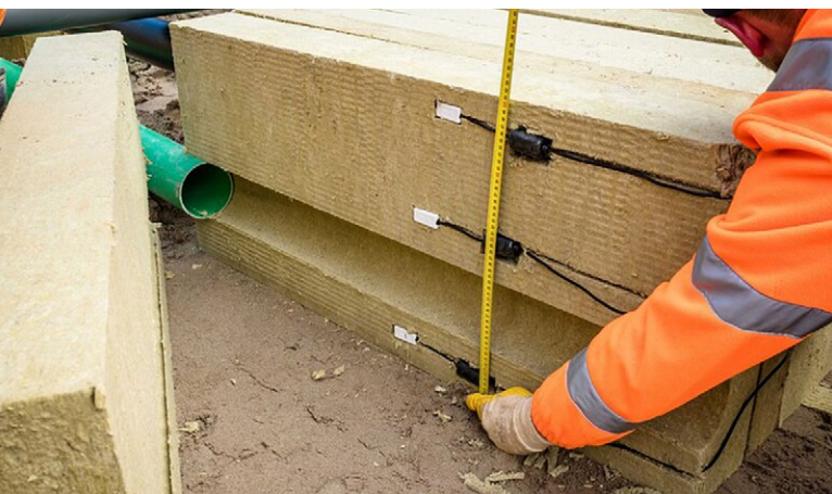
Ein Rockflow-System mit Feuchtigkeitssensoren.

Möchten Sie sicher sein, dass das Rockflow-System gut funktioniert? Installieren Sie Wasserstandsmessgeräte und Feuchtigkeitssensoren, um die Sicherheit zu erhöhen. Unsere eigenen mehrjährigen Überwachungsdaten aus Schimmert, Roermond, Horst aan de Maas, Zevenaar und aus dem Ausland zeigen übereinstimmend: Das Wasser wird innerhalb von 15 Minuten absorbiert und der Speicher ist in wenigen Stunden bis maximal einem Tag wieder leer und bereit für den nächsten Niederschlag. Diese Messungen wurden u. a. von den Ingenieurbüros IB-land, Kragten und Royal HaskoningDHV durchgeführt.