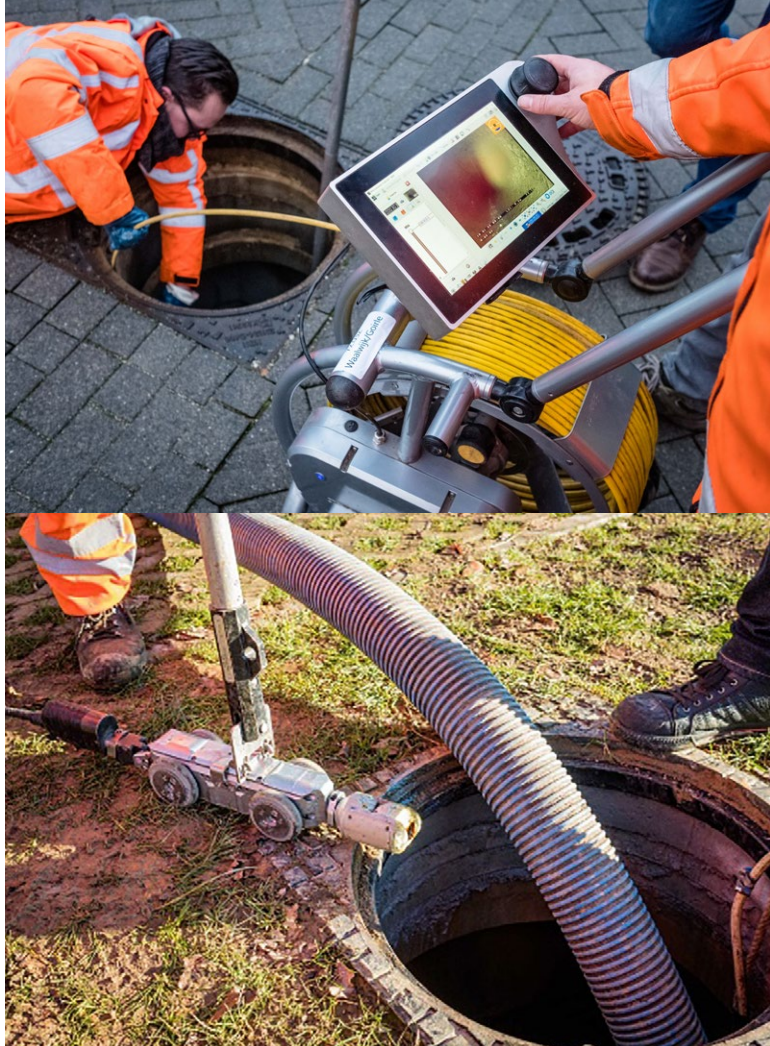
Eine Roboterkamera wird für eine Inspektion verwendet.

Kontaktieren Sie uns, um das umfassende Inspektions- und Reinigungshandbuch für Rockflow zu erhalten.