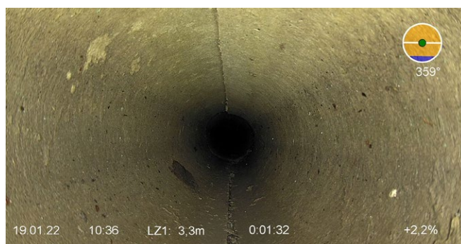
Ein sauberer Rockflow-Wasserkanal nach der Reinigung

In all diesen Punkten übertrifft Rockflow die angestrebte Lebensdauer von mindestens 50 Jahren bei Weitem, vorausgesetzt, das System ist richtig konzipiert und wird alle 2-3 Jahre gereinigt. Die Studie ergab, dass das Rockflow-System immer noch gut in der Lage ist, die aktuellen niederländischen Bedingungen für die Entwässerung (40 mm/m 2 /h) und sogar den zukünftigen strengeren Entwässerungsstandard (76 mm/m 2 /h) zu erfüllen, und zwar weit über die simulierte Lebensdauer hinaus.