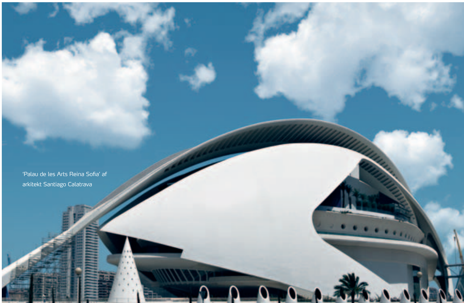
'Palau de les Arts Reina Sofia' af arkitekt Santiago Calatrava

I forventning om et stigende pres fra lovgiverne i Europa og Nordamerika om at begrænse bygningers energiforbrug samt deres udledning af CO 2 , sammen med en fortsat stigning i energipriserne, fortsætter vi vores kapacitetsin- vesteringer som annonceret i november 2006 og udspeci- ficeret i løbet af 2007. Investeringsudgifterne i 2008 for- ventes at blive DKK 2,0 mia.